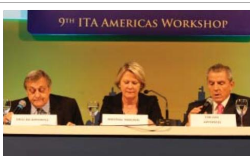
Americas Workshop 2013 en São Paulo

“The content, faculty and overall Workshop quality was excellent.”