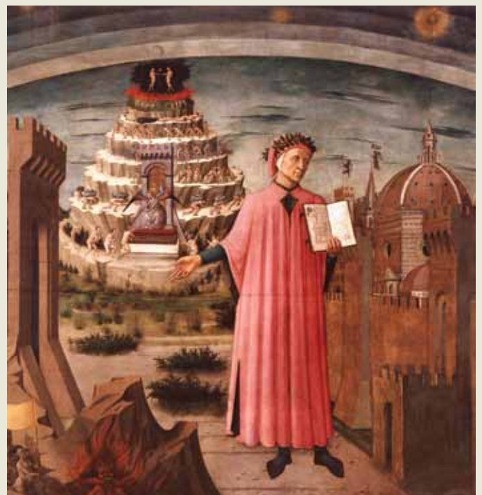
Dante Alighieri en el purgatorio.

Fuente: Antología de la literatura italiana . Barcelona, Ariel. ■