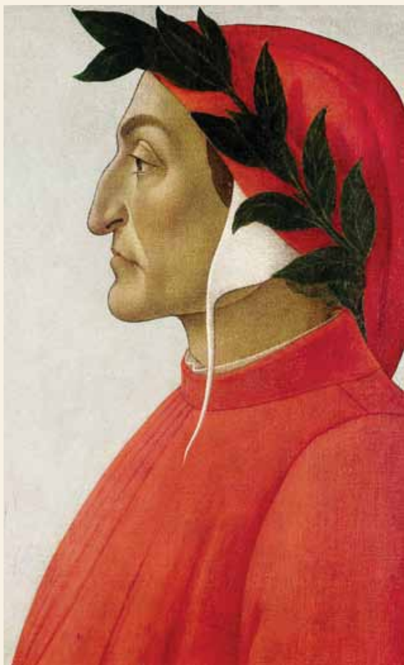
Dante Alighieri pintado por Sandro Botticelli.

Entre los capítulos diez y quince del primer libro, Dante escribe sobre su investigación para una lengua vernácula ilustre, entre las catorce variedades encontradas en la región italiana. Directamente o